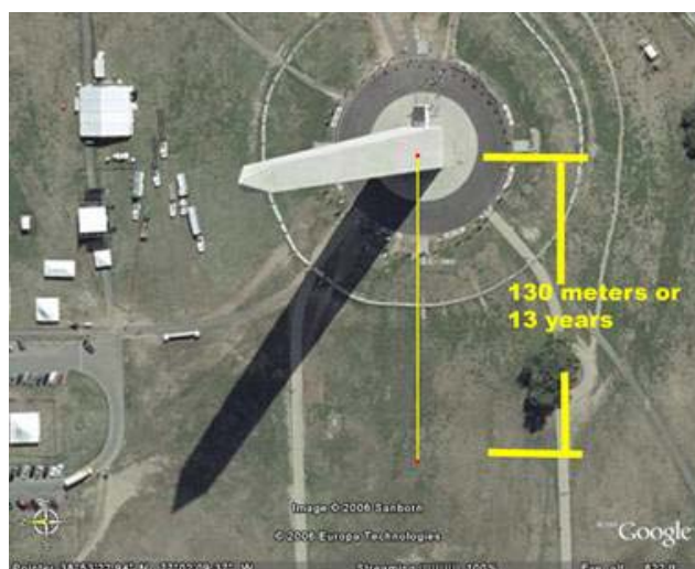
Bild 15 Höhe 555.5 3/8 Inches. 55 Fuß breit. Die 5 ist der Schlüssel. Vom Washington Denkmal sind es genau 0.55 Meilen zum White House und Jefferson Memorial.

Auch G. Washingtons Geburtstag am 22. Februar, oder 222 geben ein schönes Bild. Zur Erinnerung 2.22 Meilen sind 3.58 Kilometer. 2:22 ist auch die Zeit auf der Rückseite der $100 Note auf der Uhr in der Independence Hall.