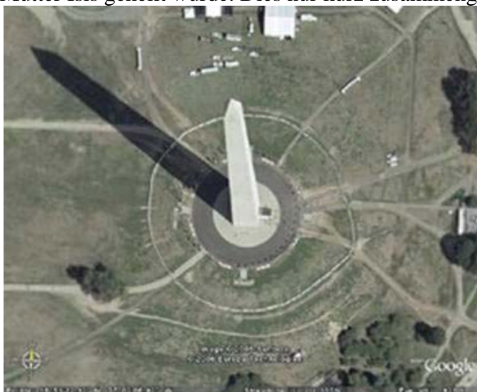
Bild 1 Das Auge des Horus? Was ist mit dem vermissten Phallus, dem Symbol der Lebenskraft, dem Zepter der Macht?

Die Legende berichtet, dass einst Osiris und seine Schwester und Gemahlin Isis über das Land am Nil herrschten. Osiris wurde von seinem eifersüchtigen Bruder Seth mithilfe einer tückischen List getötet. Er forderte Osiris auf sich in einen Sarg zu legen, der von ganz besonderer Schönheit war. Schnell schloss Seth den Sarg, warf ihn in den Nil und Osiris ertrank. Jedoch fand Isis seinen Leichnam und verlor ihn wieder an ihren Bruder Seth. Er wiederum zerriss den Körper des Toten in 14 Stücke und verteilte ihn über das Land. In ganz Ägypten suchte Isis die Teile des Leichnams. Nach langem Suchen fand sie 13 der 14 Teile von Osiris, nur der 14. Teil, der Phallus, wurde nie mehr gefunden. Sie unternahm den Versuch, den fehlenden Phallus durch eine Holzkopie zu ersetzen. Anubis, der Gott der Balsamierung, half Isis den Körper des Osiris wieder zusammenzufügen. Mit ihren göttlichen Kräften erweckte Isis ihren toten Gemahl wieder zum Leben und zeugte mit ihm einen Sohn – Horus. Horus suchte Seth, und zum Ende eines langen Kampfes gewann Horus und zerteilte Seth ebenso und verteilte ihn über das ganze Land. Im Verlauf des Kampfes zwischen Seth und Horus wurde Horus ein Auge ausgestochen, dass jedoch von seiner Mutter Isis geheilt wurde. Dies nur kurz zusammengefasst.