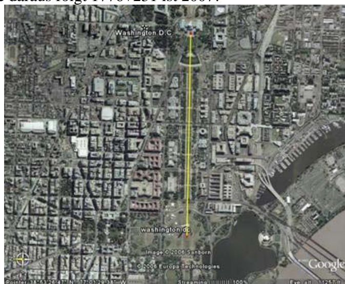
Bild 18a vom Zentrum der Grundlinie "1.776? der kleinen Pyramide sind es 2,31 Kilometer, das repräsentiert 231 Jahre. 1776+231 = 2007.

Wir wollen uns nicht in zu vielen Details verlieren, aber nächsten Dezember bei der Wintersonnenwende werden wir eine große planetarische Konjunktion erleben. Diese Konjunktion formt ein Kreuz mit der Basis im galaktischen Zentrum.