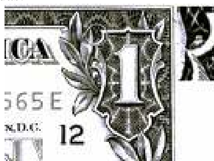
Bild 2 Bohemian Eule auf der Vorderseite des Dollar-Scheins

Das Wort Dollar, kommt vom deutschen Wort Taler. Taler waren Silbermünzen in Böhmen. Auf einer Seite vom Taler war das Bild des gekreuzigten Christus. Auf der anderen Seite war eine Schlange auf einem Pfosten mit der Nummer 21. Sein böhmischer Ursprung zeigt sich in der kleinen Eule, die auf der linken Seite der Nr. 1 auf der Frontseite des Dollarscheins gelegen ist. Das Bild unten zeigt das: