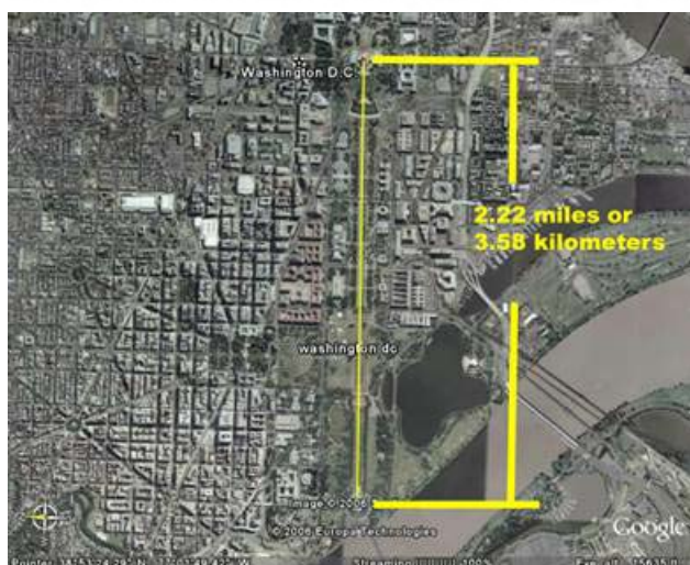
Bild 16 zeigt die Gesamthöhe der großen Pyramide; vom Lincoln-Memorial bis zum Brunnen im Capitol Hill = 3,58 km. 358 ist der Schlüssel!

Messias = maschi'ach = ח 8 (CHET) י 10 (JOD) ש 300 (SCHIN) מ 40 (MEM) = 358 (hebräisch von rechts nach links lesen, Wortstamm ohne Vokale) Schlange = nachasch = ש 300 (SCHIN) ח 8 (CHET) נ 50 (NUN) = 358