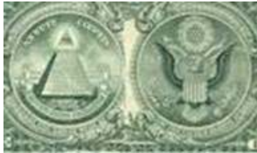
Bild 17 Die Zwei Kreise – Den abgetrennten Schlussstein der Pyramide beachten.