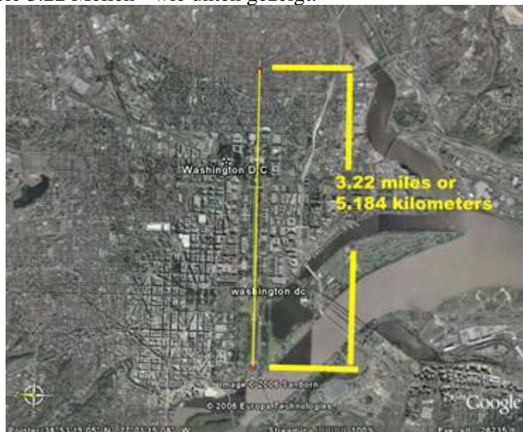
Bild 11 Der Grundriss des Capitol in Großansicht. Von der Grundlinie der großen Pyramide dem „Lincoln Memorial“ bis zur Spitze des alchemistischen „Sigillum“ sind es genau gemessen 3.22 Meilen oder 5.184 Kilometer (5.184 Jahre!) Beachten Sie auch die Ausrichtung der gemessenen Linie. Sie liegt genau in östlicher Ausrichtung und zeigt in Richtung Sonnenaufgang.

Wenn wir diese 25920 durch 5 teilen, erhalten wir 5.184 Jahre oder 5.184-Jahr-Segmente. Sehen Sie die Übereinstimmungen zwischen dem langen Mayakalender und der Geschichte von Osiris? Sie sollten. Wenn Sie Washington DC betrachten, sehen Sie das Dreieck, und auf diesem das alchemistische „Sigillum“. Wenn Sie vom mittleren Lincoln Denkmal zur Spitze des Sigillum messen, erhalten Sie 3.22 Meilen - wie unten gezeigt.