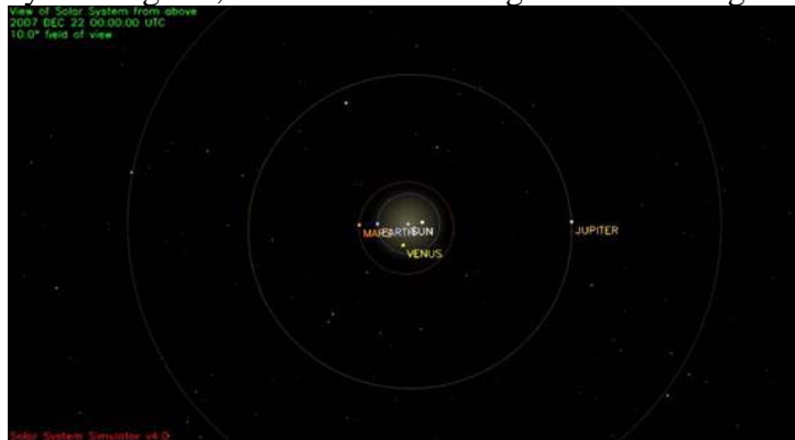
Bild 18b Sonnensystem am 22. Dez. 2007. Was wir auf dem Bild nicht sehen, ist der Planet Pluto (er befindet sich rechts von Jupiter), Saturn der unter der Venus folgt und Uranus und Neptun. Saturn und Neptun bilden den Querbalken des Kreuzes. Es ist die 23./12. Konstellation. Dies ergibt einen Vollmond am 23. Dez. 2007 – rechts unterhalb der Venus (Bibel: Off. 12,1.2 Und es erschien ein großes Zeichen am Himmel: eine Frau, mit der Sonne bekleidet, und der Mond unter ihren Füßen und auf ihrem Haupt eine Krone von zwölf Sternen).

Während der vergangenen Perioden hat sich das Klima auf der Erde mit wenig oder keiner Industrie auf unserem Planeten immer geändert. Dieses ist ein ganz natürliches Auftreten. Aber einige Zyklen können recht zerstörend sein. Auch wir werden „zurzeit“ von einer „Flut“ von Geschehnissen „überflutet“ und scheinen darin unterzugehen. Diese „Sinn[es]-, Sünd- und Sintflut“ macht uns vollkommen verrückt. Sie besteht aus Politik, Religionen, Wissenschaft, Werbung, Trends – aus dem Aufruf zur Konsumsucht, der durch Funk- und Printmedien auf uns „einströmt“ – unsere daraus resultierenden „Sehn-Süchte“ und unser nur eingebildeter Überlebenskampf. „Sintflut“ heißt auf Hebräisch „mabul“, was volksetymologisch auch als „Sündflut“ gedeutet werden kann. Mit „Sünde“ hat aber „mabul“ nicht das Geringste zu tun, denn es bedeutet wörtlich übersetzt „Verwirrung“ und „Chaos“. Es beschreibt die Zeit, in der eine suchende Seele „nicht mehr aus noch ein weiß“. Die Erbauer von Washington DC erklären uns, wann der Zyklus beginnt, in Übereinstimmung mit dem heutigen Kalendersystem.