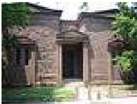
A Skull and Bones Hauptquartier bei Yale