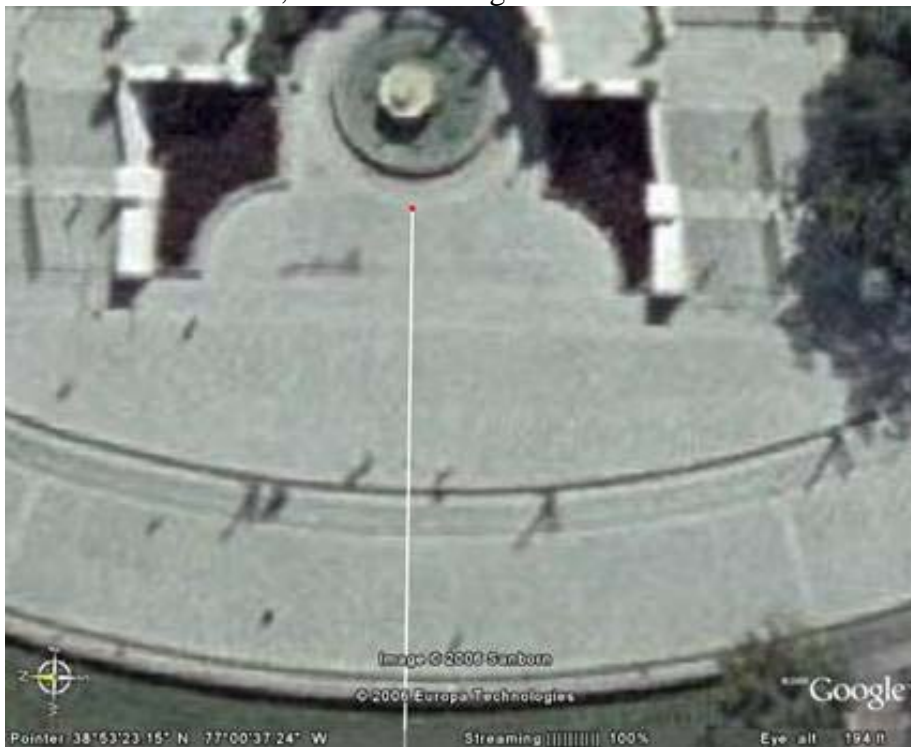
Bild 22 Der Punkt von der Grundlinie 1776 aus. Es waren 7 Bomben in 7 Zügen