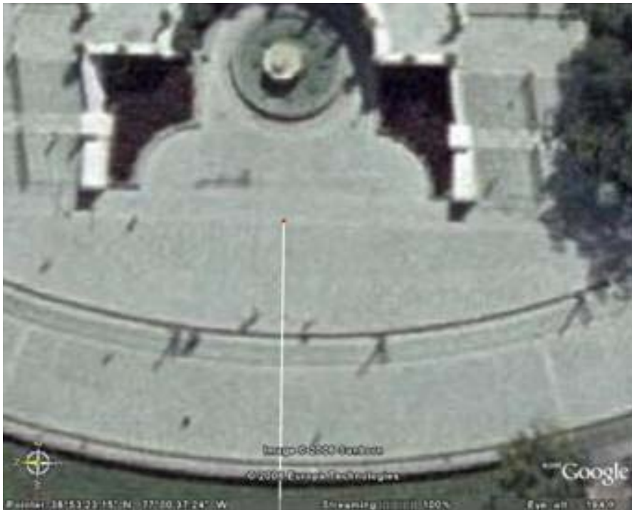
Bild 21 Der Angriff am 07.07.2005 in London ergibt die Markierung vor dem Brunnen 11. Juli 2006 - Indien, Bomben im Zug