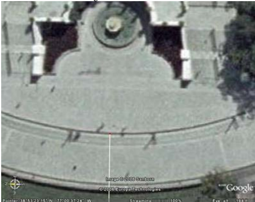
Bild 20. Die Anschläge vom 11.03.2004 treffen von der Grundlinie aus gemessen genau diese Linie vor dem Brunnen.