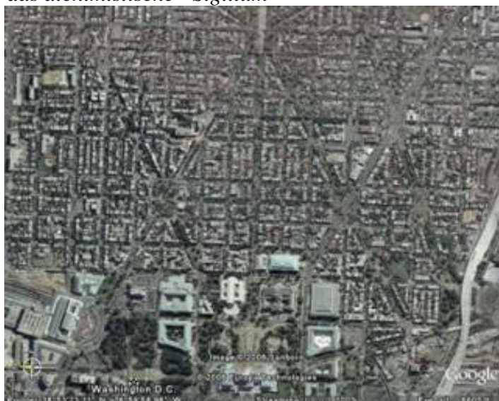
Bild 10 Das alchemistische Sigillum, lokalisiert an der Spitze des Capitol Hill

Der Schlüssel zu Washington DC liegt in der Vermessung. Um das Geheimnis zu lüften, müssen wir Washington DC vermessen. Sobald vermessen wird, sehen Sie, was Washington DC wirklich darstellt. Die Deutung der Masse kann nur verstanden werden, wenn Sie das Solarsystem und den langen Zählimpuls des Mayakalenders verstehen. Beginnen wir mit den Mayas.