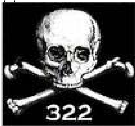
B Skull and Bones Logo