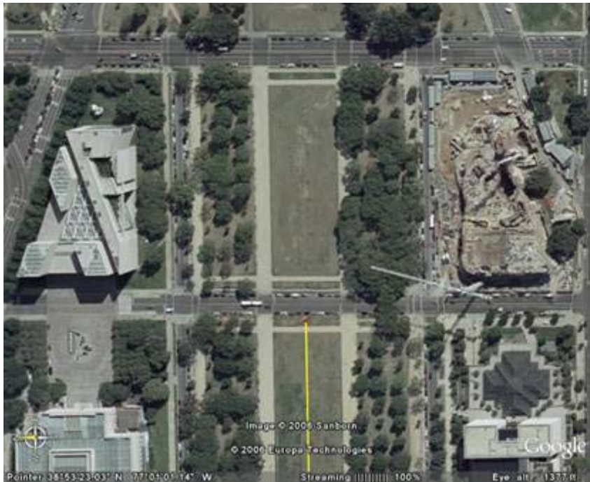
Bild 24 Eintritt der USA in den 2. Weltkrieg 1941

Wie konnte dieses Geheimnis so lange verborgen bleiben?