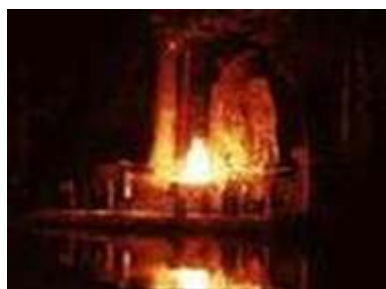
Bild 4 Die Zeremonie des Bohemian Club – Schauen Sie hierzu auch das Video

Die Eule ist also das Markenzeichen eines Clubs in Kalifornien mit dem Namen Bohemian Grove. Jedes Jahr treffen sich bedeutende Führungskräfte der angloamerikanischen Elite und diskutieren über politische Strategien unter Ausschluss der Öffentlichkeit. Das ist noch nicht alles, denn dort finden okkulte Rituale statt. Sie werden es nicht glauben, im Vordergrund einer riesigen Eule wird eine Kinderpuppe verbrannt. Was soll das bedeuten? Ein brennendes Kind vor einer Eule?