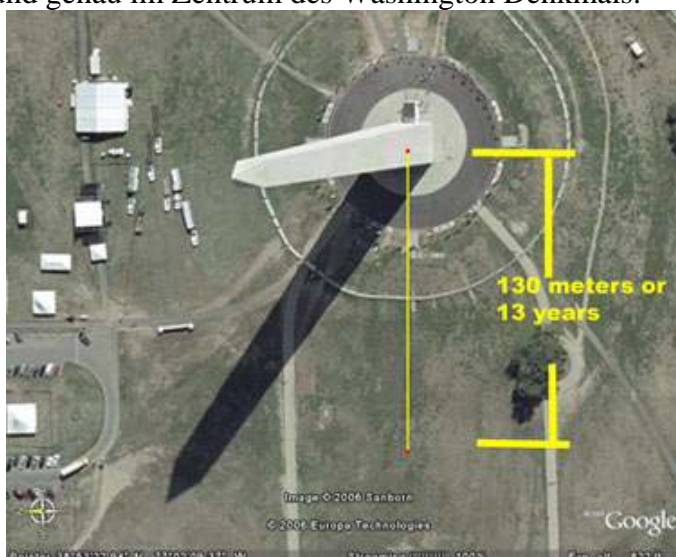
Bild 14 gemessen von 1776 der Grundlinie der kleinen Pyramide bis zum Washington Denkmal 10 Meter = 1 Jahr, 130 Meter = 13 Jahre, steht für 1789 n. Chr. Das Washington Denkmal ist auch ein Teil des Rätsels. Das Denkmal ist 555 Fuß und ein paar Zerquetschte hoch. Es ist exakt 55 Fuß breit. Der Schlüssel ist die Nummer 5. Jetzt multiplizieren wir 5 x die Länge vom Lincoln Memorial bis zur Spitze des Sigillum so erhalten wir 5 x 5.184 Kilometer oder 25920 dieselbe Länge oder Dauer eines kompletten Zyklus.

Jetzt messen wir von der Grundlinie der kleinen Pyramide "1.776? 130 Meter nach oben. 130 Meter repräsentieren 13 Jahre. Jetzt sind wir im Jahr 1789, in dem Jahr, wo G. Washington Präsident wurde, und genau im Zentrum des Washington Denkmals.