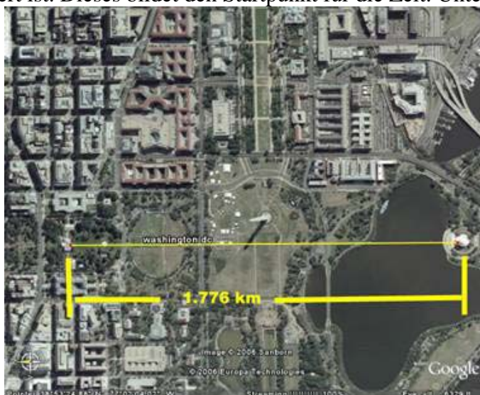
Bild 13 Messung vom Weißen Haus zum Jefferson Memorial: 1.1 Meile oder 1.776 Kilometer Dies ist das Gründungsjahr, von wo aus die Zeitachse n. Chr. verläuft, die Grundlinie der kleinen Pyramide.

Kilometer. Dieses ist das Startdatum, von dem aus die Unabhängigkeitserklärung und Sirius der Hundestern markiert ist. Dieses bildet den Startpunkt für die Zeit. Unten im Foto: