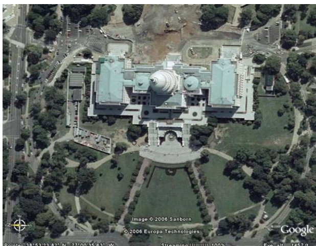
Bild 1. Capitol Hill

Diese Vorstellungen sind dazu bestimmt, das Denken zu schulen, nicht, es zu informieren.