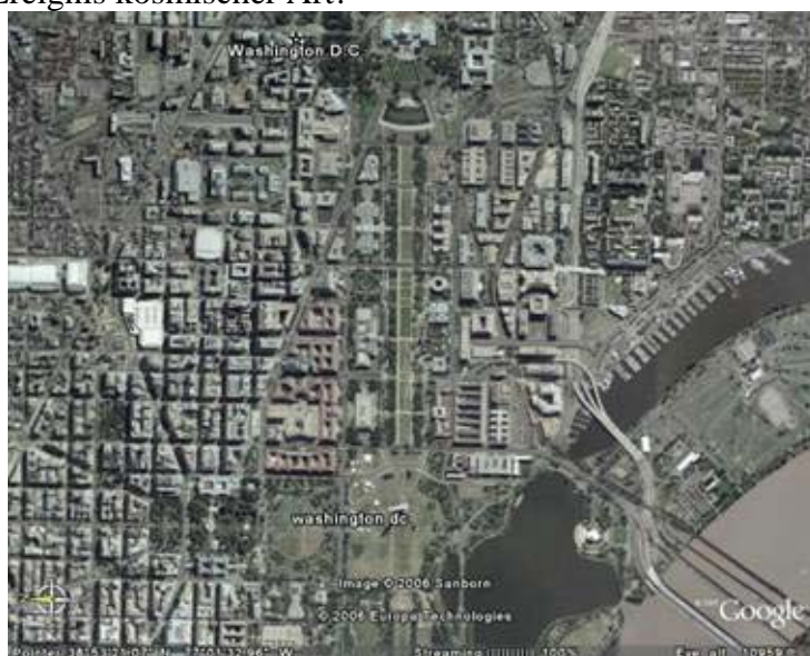
Bild 8 Sehen Sie die kleine Pyramide? Ziehen Sie eine Linie vom Capitol Hill zum White House, weiter zum Jefferson Memorial und zurück zum Capitol Hill. Es ergibt eine Pyramide, mit einer Grundseitenlänge von 1.1 Meile oder 1.776 Kilometer.

Die Architektur von Washington DC verkündet den Beginn eines neuen geistigen Zeitalters. Es ist ein Ereignis kosmischer Art!